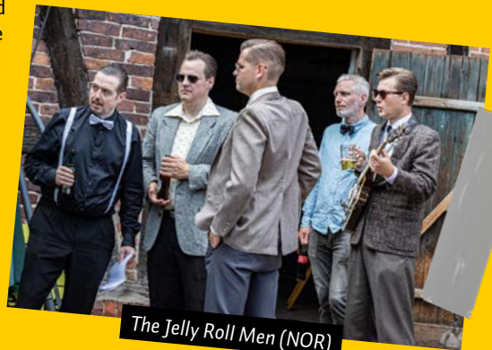
The Jelly Roll Men (NOR)